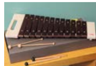
5P リズム・ポコ ザイロフォン 12音 ダイアトニックスケール

知的好奇心がどんどん膨らむ頃。ちょっと難しい事にチャレンジする事は、身体と心の成長にも繋がりますね。「リズム・ポコ ザイロフォン」は国産ならではの正確な調律で本格的な木琴。お子さまの音感を養う事にも役立ちます。音階が12音あるので、出来る曲の幅が広がります。白木とロビニアのシンプルで大人っぽいデザインもオススメです。