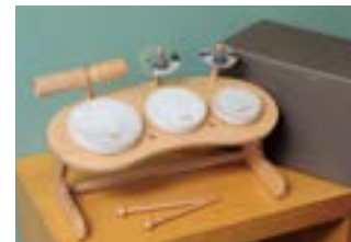
4P リズム・ポコ ドラムセット

コミュニケーションに目覚め、ごっこ遊びが始まる頃でもあります。「リズム・ポコドラムセット」はドラム・シンバル・ウッドブロックからなる少しだけ複雑な作り。自由な表現が出来るので、好奇心も大満足。スティックを追加すればお友達と合奏ごっこで遊ぶ事もできます。大きくなっても長く使えるように交換パーツもご用意しています。