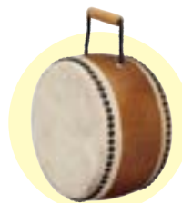
太鼓本体・持ち手時