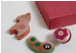
3P キッズパーカッション リズムミックベビーセット

赤ちゃんが沢山の“はじめての音”を体験する時。周囲に流れる優しい音に包まれると、おだやかな気持ちでいられるでしょう。また、自分で物がつかめるようになったら、握って振って音が出る事に夢中になる事、間違い無し。木のぬくもりを感じられる「リズムミックベビーセット」は、角の無いフォルムと水性塗料を使用し、安全にも配慮した知育楽器です。