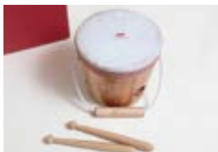
8P キッズパーカッション ベビードラム

自分でパチを持ち太鼓を叩くと、叩く場所により色んな音が出る。なんだかとても面白い！少しの力でも良い音の出る「ベビードラム」は、出来る事の増えた頃にぴったり。サウンドホールがあるので、お座りしてドラムを床に置いて手で叩いても良く響きます。絵本の読み聴かせの時に一緒に叩いたりしても楽しいですね。可愛いハンドルが付いて付いているのも自慢です。