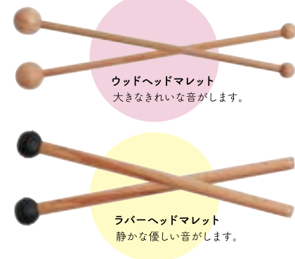
ウッドヘッドマレット 大きなきれいな音がします。

ていねいに調律された国産の木琴。 ダイアトニックスケール(全音階)なので 色々な曲にチャレンジできます。 馴染みのある童謡6曲の楽譜をお付けしました。 また、異なる音の出るマレット (ウッドヘッドマレット、ラバーヘッドマレット)も 付属されています。音の違いも楽しめます。